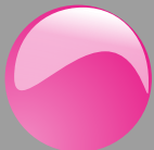
Fucsia Cod. P30B02