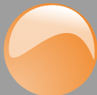
Arancione Cod. P30B07