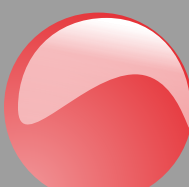
Rosso Cod. P13B08