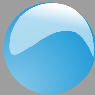
Azzurro cielo Cod. P15B13