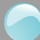
Azzurro pastello Cod. P30B12L

Questo formato portafoto e lavagna sono compatibili con formato 13x18 puzzle line