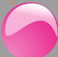
Fucsia Cod. P13B02