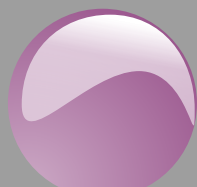
Viola Cod. P13B05