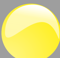
Giallo sole Cod. P13B06