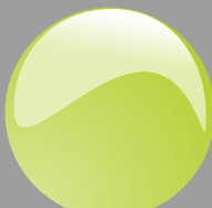
Verde prato Cod. P13B10