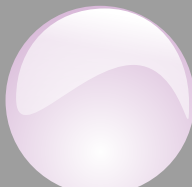
Lilla Cod. P13B03