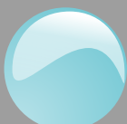
Azzurro pastello Cod. P30B12