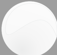
Bianco Cod. P13B15