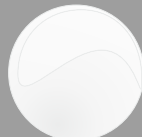
Bianco Cod. P30B15