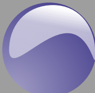
Blu oceano Cod. P13B14