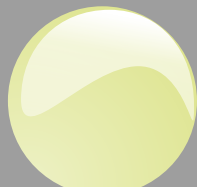
Verde pastello Cod. P13B09