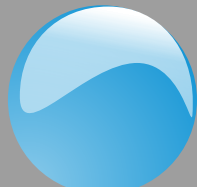
Azzurro cielo Cod. P13B13