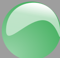
Verde bottiglia Cod. P13B11