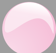
Rosa pastello Cod. P13B01