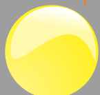
Giallo sole Cod. P30B06