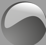
Nero Cod. P13B16